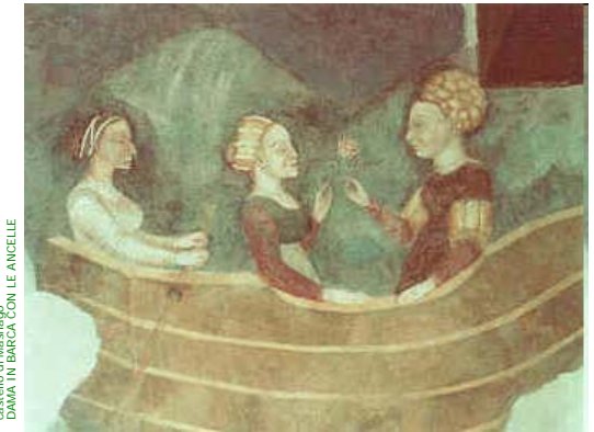
Disegno di Leonardo DAMA IN BARCA CON LE ANCELLE

Il ruolo delle professioni sanitarie nella medicina delle complessità